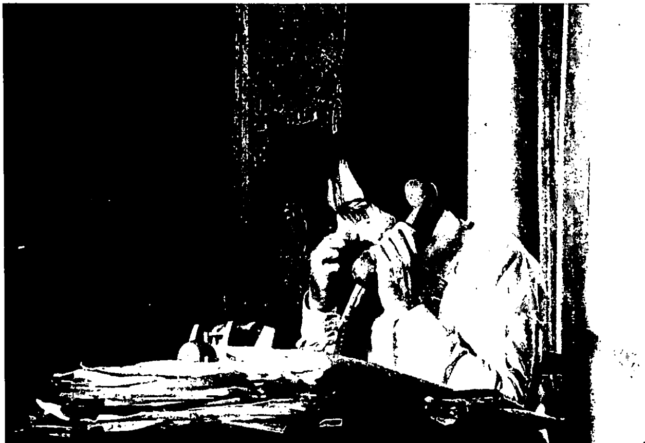
Anatomie d'un rapport , de Luc Moullet et Antonietta Pizzorno (Luc Moullet).